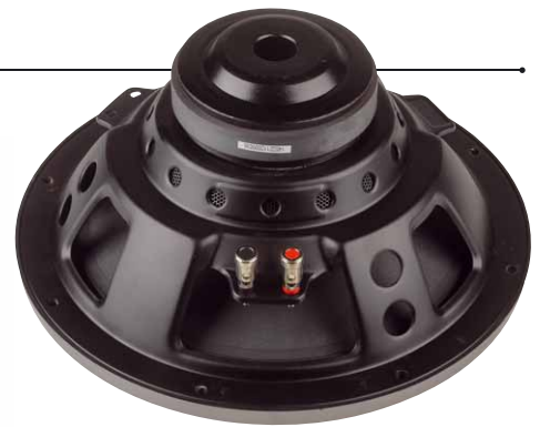
Magnet vergessen? Bei genauerem Hinsehen findet man den zierlichen Magneten des Z112