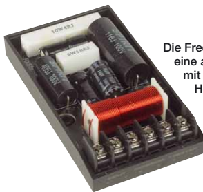
Die Frequenzweiche bietet eine aufwendige Schaltung mit steiler Trennung des Hochtöners und Frequenzgangkorrektur der Tiefmitteltöners