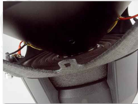
Die Zuleitungen zur Doppelschwingspule verlaufen direkt vom Terminal zur Membran

► Mit nur 130 Euro ist der RX112D der Einsteigersubwoofer von Phoenix Gold. Wir überprüfen, was man mit ihm anfangen kann.